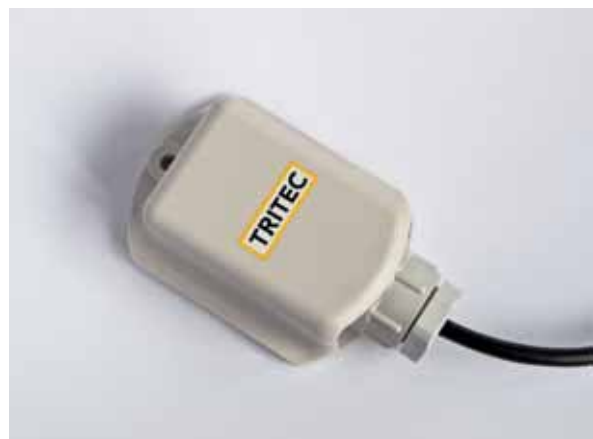
Le capteur de température extérieure Pt1000 TRITEC