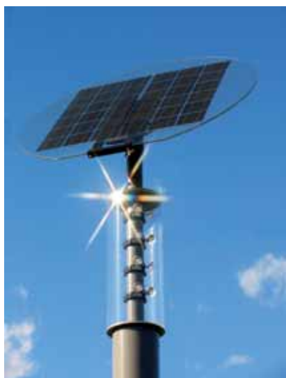
L'attraente modello delle Ecostar, con modulo in vetro di sicurezza, le mette sicuramente in «buona luce».