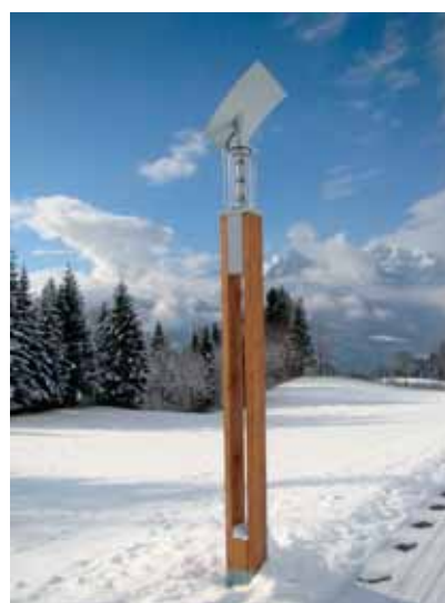
Il sobrio design in legno e la luce di orientamento donano alle Doble-Sol un'estetica piacevole, giorno e notte.