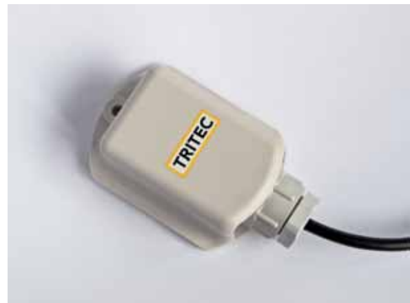
TRITEC Außentemperatursensor Pt1000